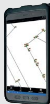
Samsung-Tablet Tab Active 3