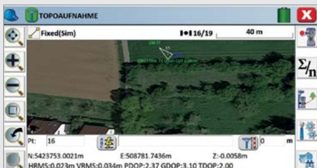
Aufnahme von Punkten und Linien mit Luftbild im Hintergrund

UNTERSTÜTZTE FORMATE: LandXML, DXF, DWG, DTM, DGM, ASCII, TXT, CSV, SHP, SDR, MXD u.v.m.