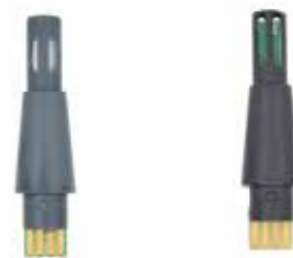
Hygrostick Teilnummer POL4750, für Anwendungen mit hoher Feuchtigkeit.