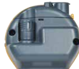
Quikstick ST POL78751, Standard mit allen MMS3 Kits und mit der gleichen Leistung wie der Standard Quikstick. Ein Quikstick ST kann während der Verwendung der Stifte mit dem MMS3 verbunden bleiben.

MMS3 kann mit drei Arten von austauschbaren Feuchtigkeitssonden verwendet werden, dem Hygrostick, dem Quikstick und dem Quikstick ST. Der Hygrostick (grau POL4750) kann für Anwendungen mit hoher Feuchtigkeit wie Betonmessung eingesetzt werden. Quikstick (schwarz POL8750) ist ein universell einsetzbarer, schnell reagierender Vollbereichssensor.