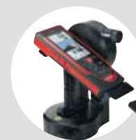
Leica FTA360-S Adapter Art.Nr. 828414