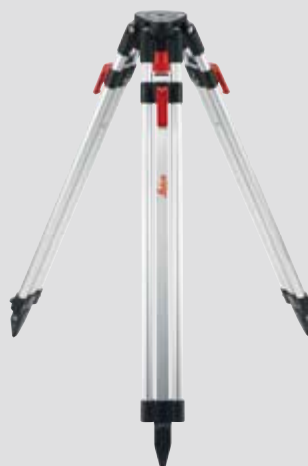
Leica TRI 200 Stativ mit 1/4" Gewinde Art.Nr. 828426