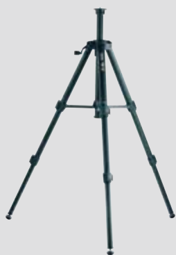
Leica TRI 70 Stativ Art.Nr. 794963