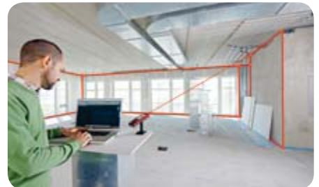
Echtzeitübertragung von Punkt-Koordinaten