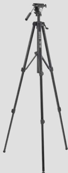
Leica TRI 100 Stativ Art.Nr. 757938