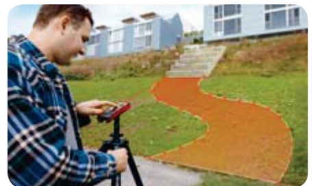
Messen von Punkten und Flächen